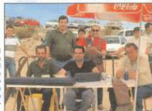
El concurso de tiro al plato que se desarrolla junto al recinto ferial el sábado y el domingo de Feria, reúne cada año a un importante número de participantes con una amplia cantidad de premios.