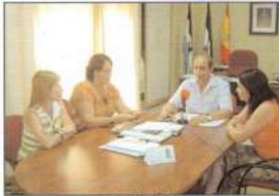
Firma del convenio de colaboración entre Ayuntamiento y Asociación de Niños Saharauis.