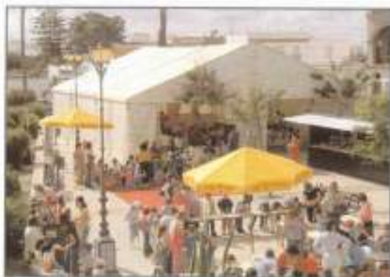
Feria del libro homenaje al IV Centenario de la publicación de El Quijote.