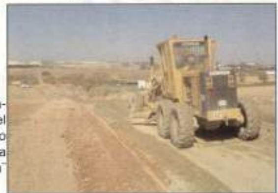
Adecantamiento del "Camino de la Ermita"

Feria y Fiestas Patronales 2005 - El Cuervo de Sevilla