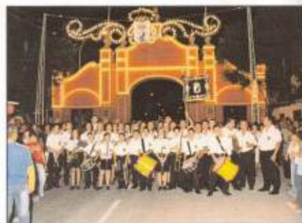
Los jóvenes componentes de la Banda de Música Municipal Nuestra Señora del Rosario participan todos los años en la inauguración de la Feria. Nuestro aplauso para ellos por su dedicación, esfuerzo y buen hacer y nuestro agradecimiento por su colaboración.