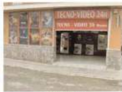
C/ Madrid, 19