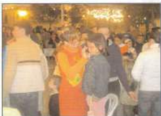
Entrega de cartas a los Reyes Magos 2005.