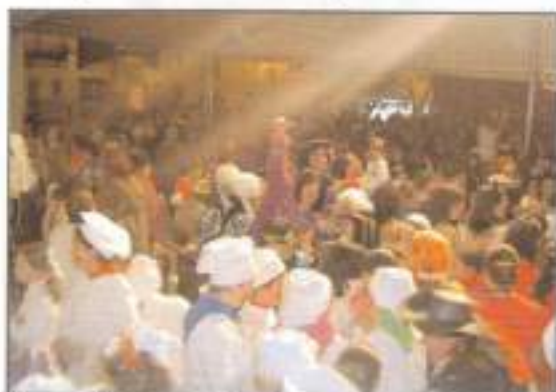
Noche de sábado de Carnaval en la Plaza de la Constitución.