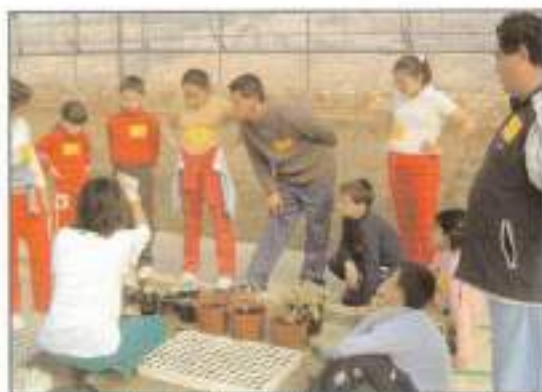
Jornada de Medio Ambiente en el Centro Ocupacional "Germán Gómez Medina".