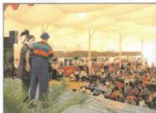
Los más pequeños esperan impacientemente la gala infantil que, como todos los años, viene cargada de juegos, risas y actividades de entretenimiento.