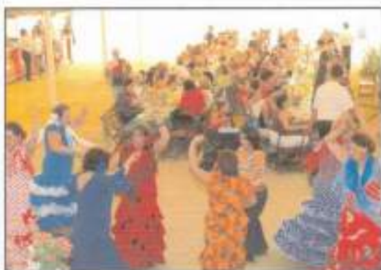
El Día de la Mujer, que se celebró el 7 de octubre, llenó el Real y la Caseta Municipal de mujeres que le dieron a la Feria un toque especial de color y alegría, inundándola de volantes y lunares al más típico estilo andaluz.