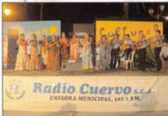
Concurso de coros en el verano cultural.