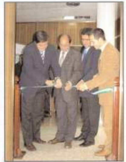
Inauguración del Centro Guadalinfo.