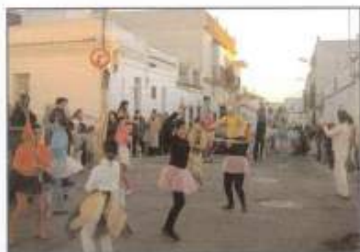
Pasacalles Teatro Esperpento.