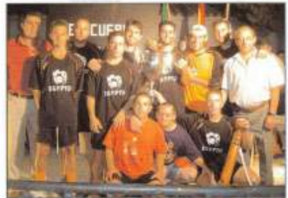
Campeones de fútbol sala del verano 2005.