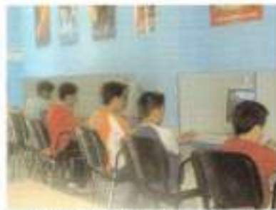
Avda. José Antonio Gallego