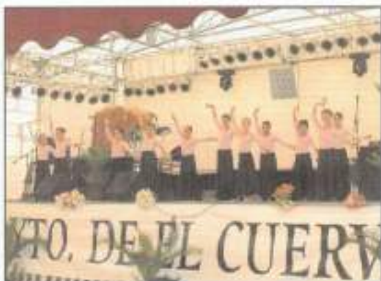
Las alumnas del aula de danza deleitaron al público de la caseta municipal, con las coreografías y bailes que han aprendido.