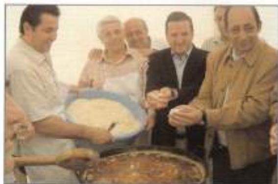
Ajo, de la asociación de hombres que participaron en la VIII edición del Día del Pan