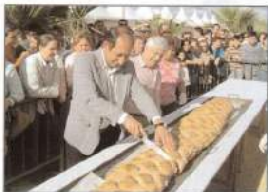
Degustación de bocadillo gigante en la VIII edición del Día del Pan.