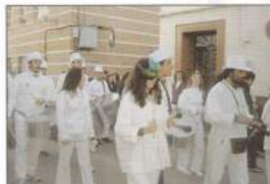
Pasacalles de los alumnos del curso de percusión del programa "Experiencias Creativas Jóvenes".