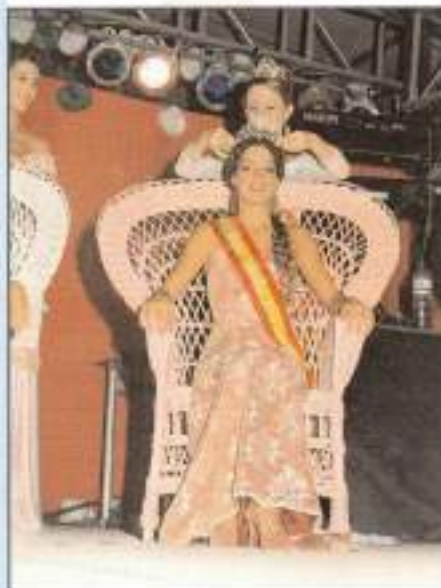
El acto de coronación de la Reina Infantil y Mayor en la caseta municipal la primera noche de Feria, se ha consolidado como una de las actividades que despierta mayor expectación.

Los Romeros de la Puebla llenaron una vez más la Caseta Municipal. El público disfrutó con la actuación de uno de los grupos más emblemáticos de nuestra tierra