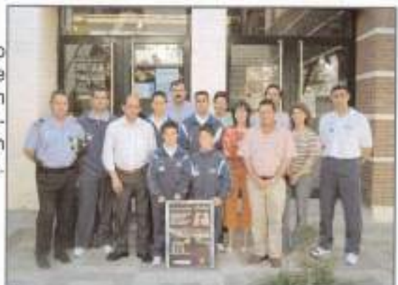
Concurso de Educación Vial realizado en Ávila.