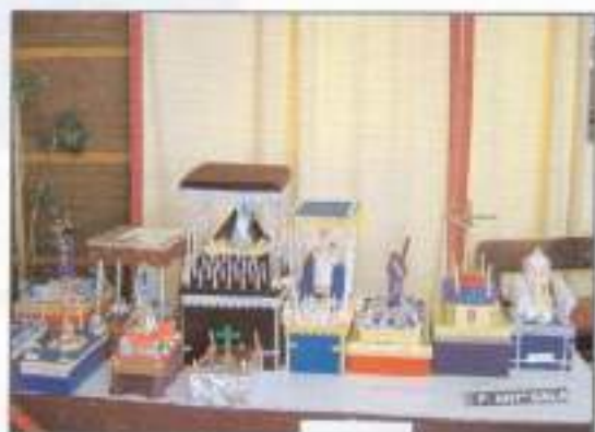
Concurso Infantil de pasos de Semana Santa.