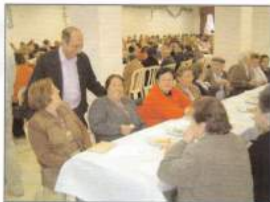
Merienda con la tercera edad.