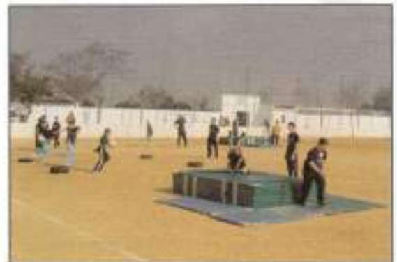
Alumnos de los centros de primaria participan en "Jugamos tod@s 2005".