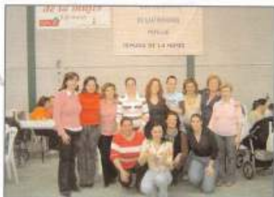
Concurso Gastronómico en la Semana de la Mujer.