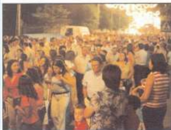
Cada año aumenta el público que asiste al acto de inauguración oficial de la Feria. La luz y la música dan inicio a unos días de fiesta y de alegría en los que hacemos un paréntesis en nuestros quehaceres cotidianos.