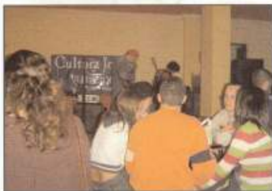
II Edición Cultura Joven. Pub El Limite