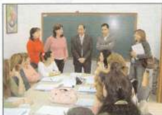
El Diputado de Juventud visita el proyecto Renace.