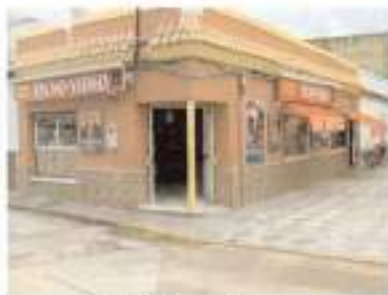
C/ Olvera, 14