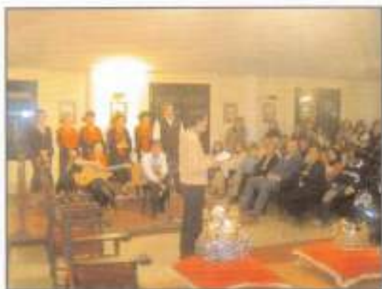
Presentación de los Reyes Magos 2005.