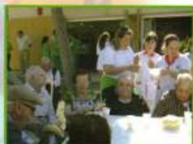
Los mayores del Centro de Día y el Centro Germán Gómez disfrutando al aire libre.