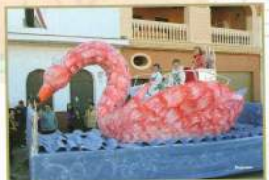
Carroza de la Reina Infantil y sus damas