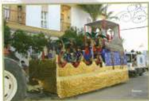
Carroza del Rey Baltasar