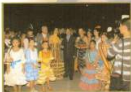
Autoridades locales acompañadas de Reinas y Damas durante la inauguración de la feria 2007