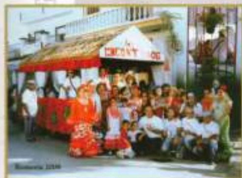
Premio especial a la carroza "Los Encuentros" en la Romería 2008