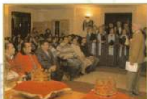
Presentación Reyes Magos 2008