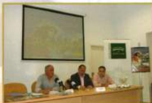
Presentación del Cartel de Romería 2008 en la Casa de la Provincia