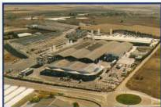
Planta para elaboración de Escayolas y Yesos. Ctra. Nacional. IV, Km 606,100.