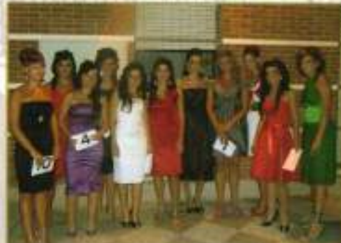
Candidatas a Reina Mayor 2008