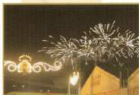
Función de fuegos artificiales 2007