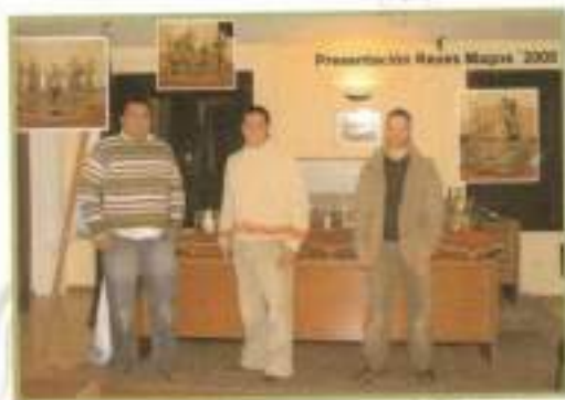
Nuestros Reyes Magos 2008