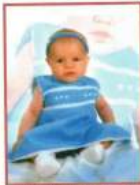
Silvia Izquierdo Gutiérrez