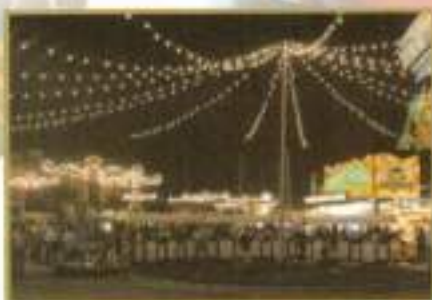
Vista nocturna de la Feria 2007