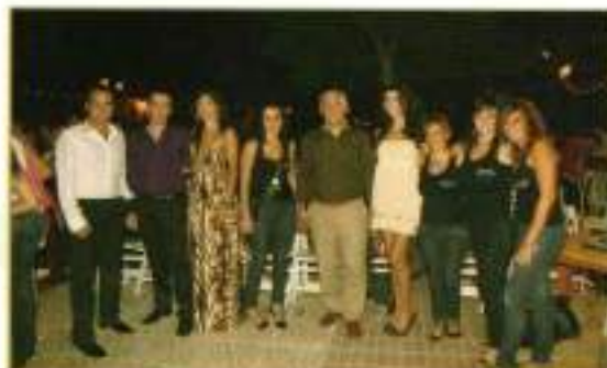
Jurado de la elección 2008 acompañados por el Delegado de Festejos.