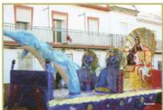
Carroza de la Reina Mayor y sus damas