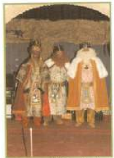
Nuestros Majestades los Reyes Magos 2008