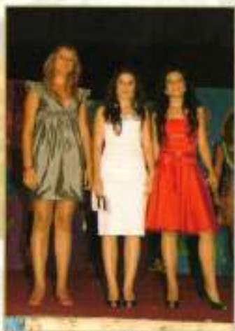
Reina y Damas, Mayores