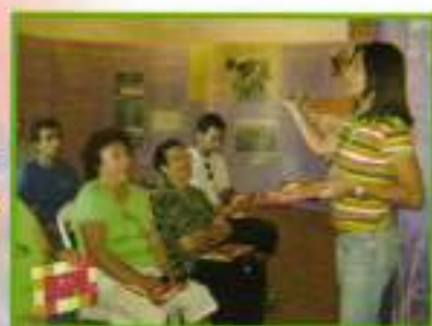
La Mujer y su implicación en el Medio Ambiente