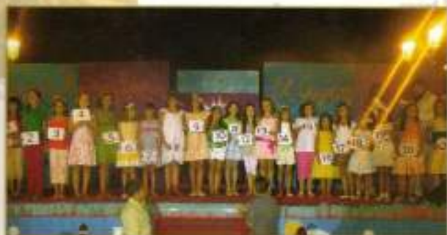
Candidatas a Reina Infantil 2008