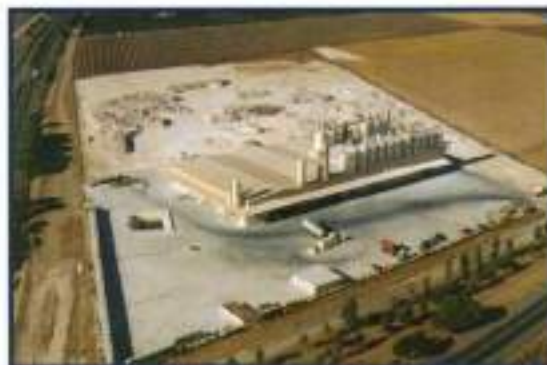
Planta para elaboración de Prefabricados de Escayolas. Ctra. Los Tollos, Km. 3.