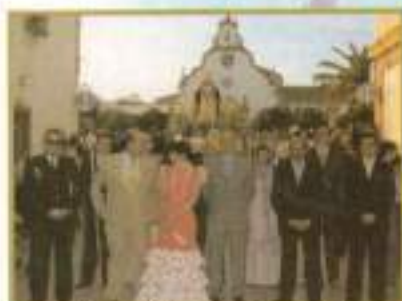
Recorrido procesional d Ntra. Sra. del Rosario