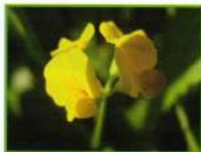
Fotografía ganadora en el apartado flora.

La Delegación de Medio Ambiente celebró su día mundial con un concurso fotográfico, junto a colectivos de nuestro pueblo en el aula de la naturaleza con actividades al aire libre.