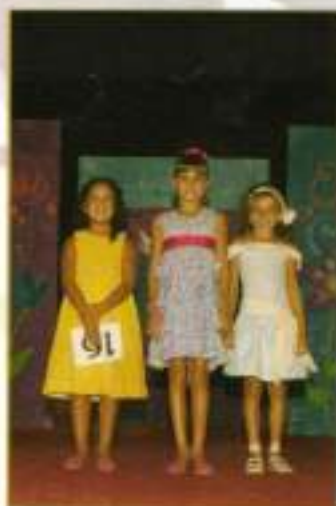
Reina y Damas, Menores