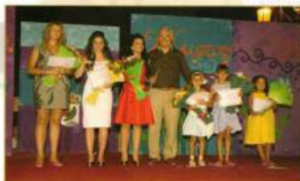
Reinas y Damas con el Delegado de Fiestas.