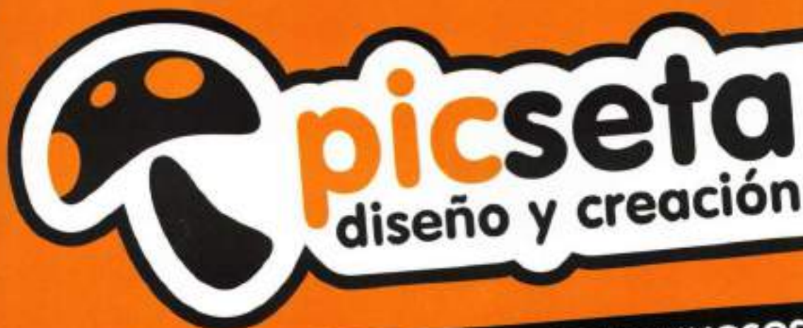
IMAGEN CORPORATIVA - RÓTULOS LUMINOSOS CAMISETAS - ROPA LABORAL - VALLAS - LONAS IMPRESIÓN GRAN FORMATO - CORPORALES

info@picseta.com 95 597 9320 www.picseta.com Avd. de Lebrija, 13 El Cuervo (Sevilla)