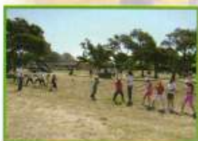
Los más pequeños durante una de las actividades del aula de la naturaleza.