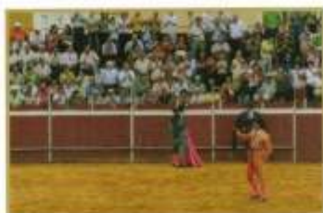
Jesús González triunfó en su pueblo