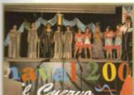
Musas y Ninfas durante el Carnaval 2008