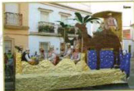
Carroza del Rey Melchor