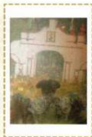
Benjamín Bejarano Medina