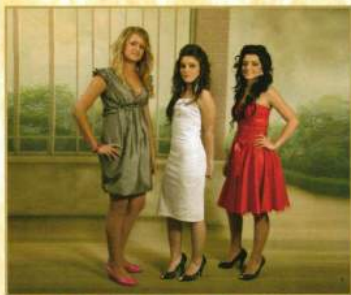
Reinas y Damas mayores 2008