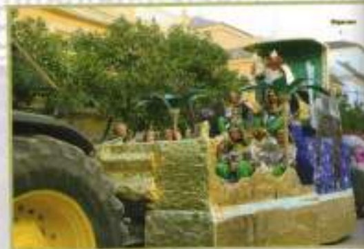
Carroza del Rey Gaspar