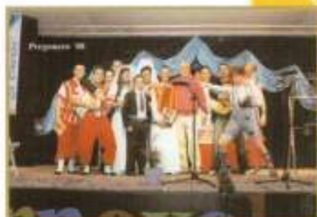
El Delegado de Fiestas acompañado del pregonero 2008 y su agrupación.