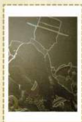
Benjamín Bejarano Medina