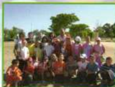
Los más pequeños participantes en el aula de la naturaleza