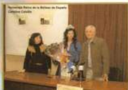
Recepción Municipal a la Reina de la Belleza de España Carolina Calvillo