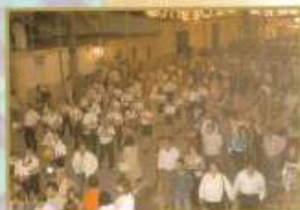
Comitiva Municipal dirigiéndose a la coronación de las Reinas y Damas