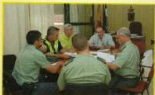
Reunión del Alcalde y el Delegado de Seguridad Ciudadana con Policía Local y Guardia Civil para analizar la seguridad durante la Feria 2008