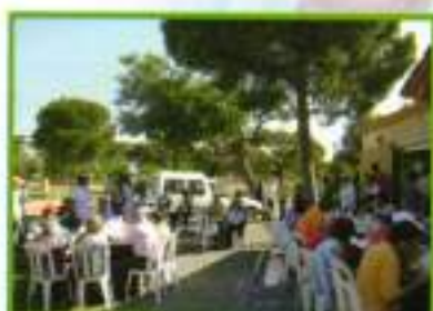
Los mayores del Centro de Día y el Centro Germán Gómez Medina disfrutaron de un hermoso día con un desayuno saludable