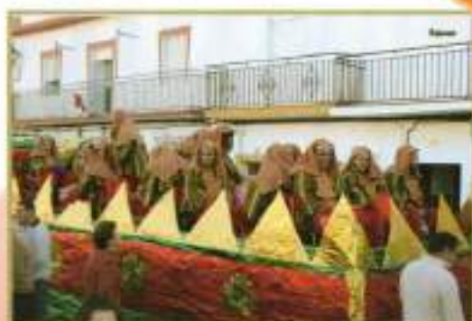
Carroza de la Asociación "El Arte de Vivir"