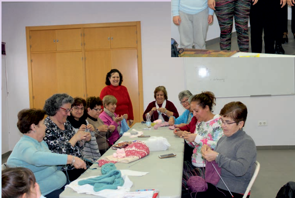
ELABORACIÓN DE PRENDAS DE PUNTO