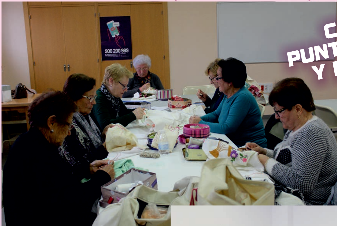
CALADO PUNTO DE CRUZ Y BORDADO